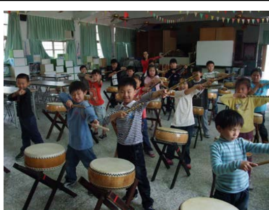
活動中心太鼓練習

六、學校現有硬體說明：包括實施藝文之教室及展演場地現況(含現場照片 2-5張)、設施規劃及教具等各項配套措施。