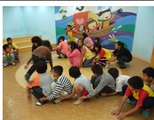
玉山圖書館階梯舞台