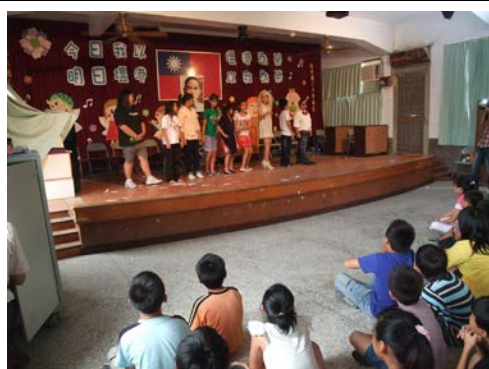
活動中心展演舞台