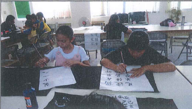
書法課時，學生認真寫書法