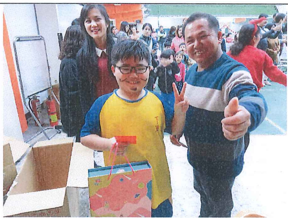
迎新年晚會當天，每戶贈送一份春聯。