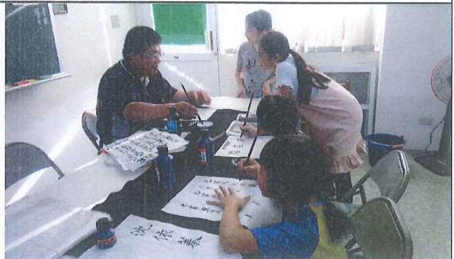
書法課，吳老師一對一個別指導。