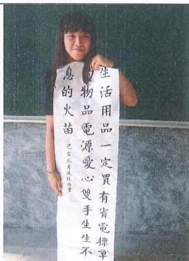
書法課，學生寫作品，參加書法比賽。