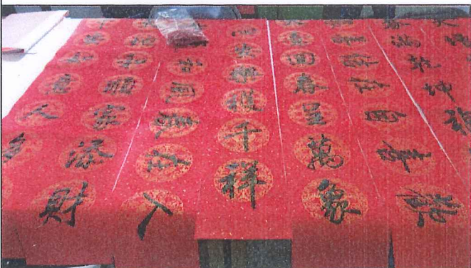
為學校迎新年活動，寫春聯，贈送社區家長。