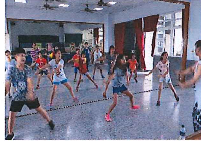
影像扎根計畫+肢體表演課程