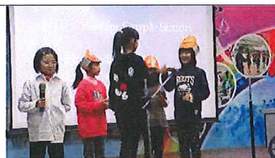
繪本展演讓孩子能開口說、勇敢秀！