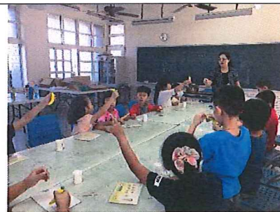
黏土課程讓學生動動手指玩創意！