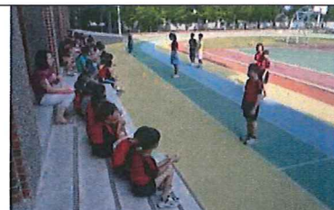
綜合球場邊階梯看台