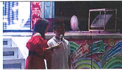
107年母親節慶祝活動