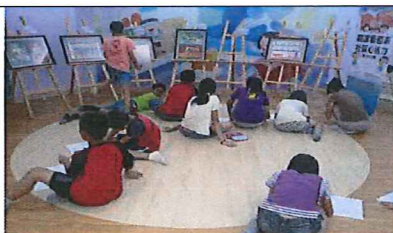
圖書室內的小劇場