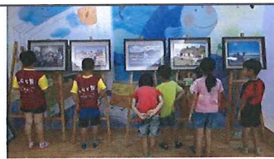
研揚藝術光點樸素藝術展