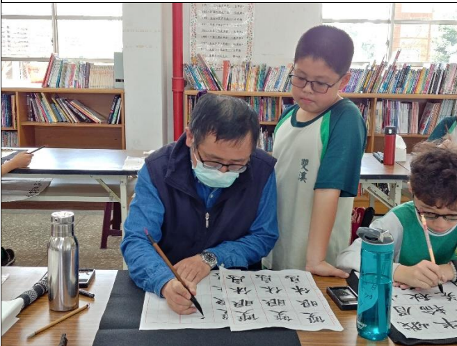
中高年級：智永楷書教學