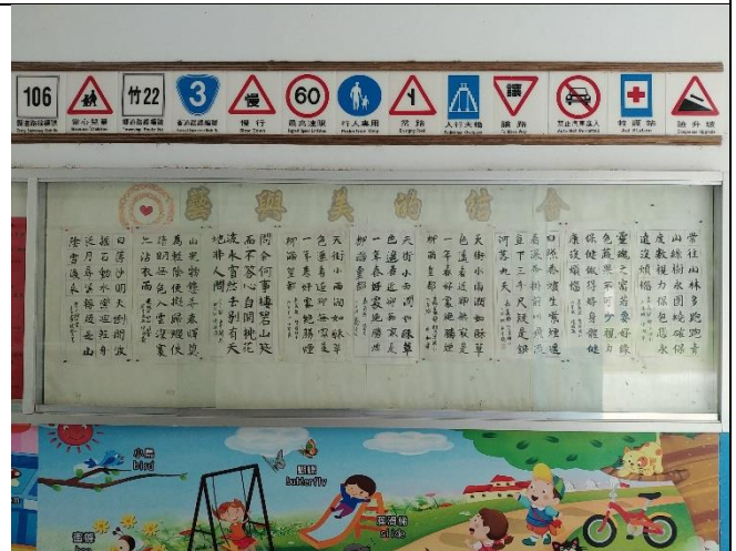
校內語文競賽優秀作品展出