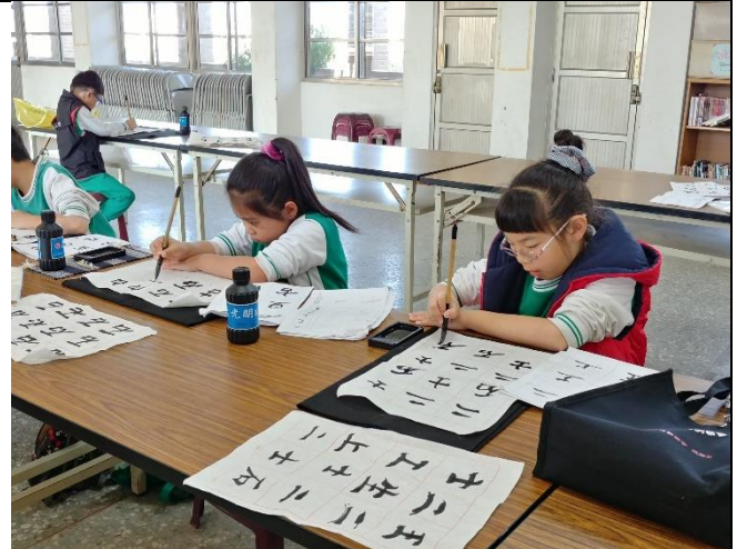
二年級：歐陽詢楷書基礎教學