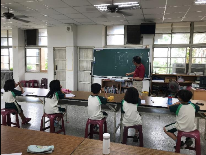
一年級：書法字體結構教學