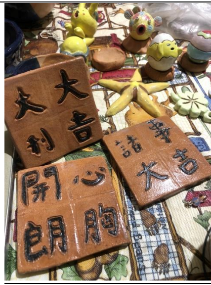
學生製作書法陶板作品