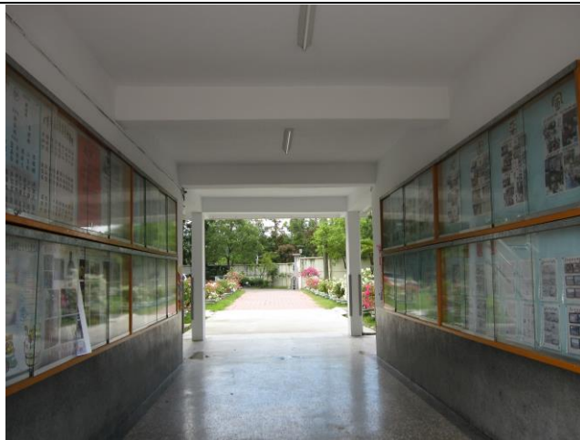
照片說明：文化走廊牆