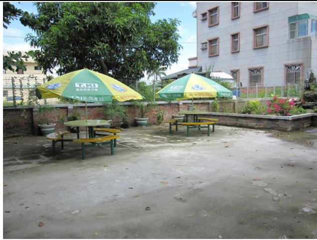
照片說明:荷風長廊角落