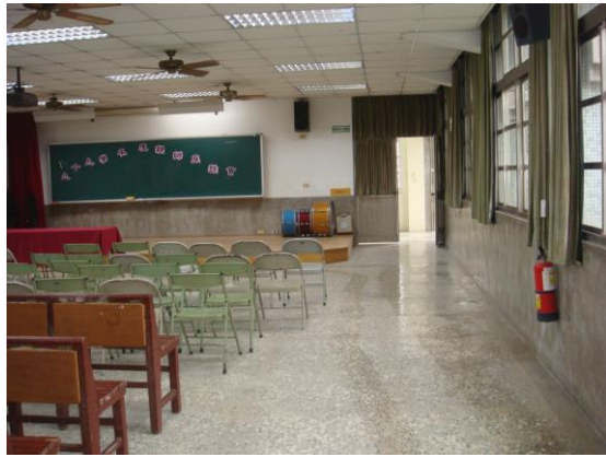
照片說明：露天的動態表演場。