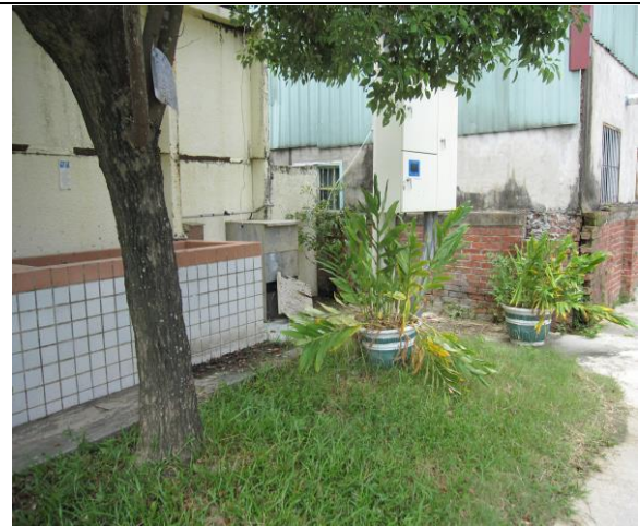
照片說明：西廁入口前磚牆