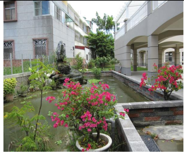
照片說明：荷風長廊角落