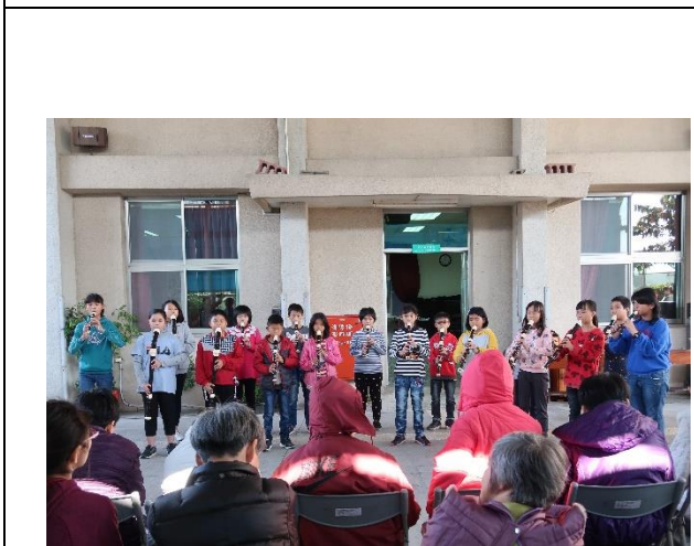
學生表演音樂成果