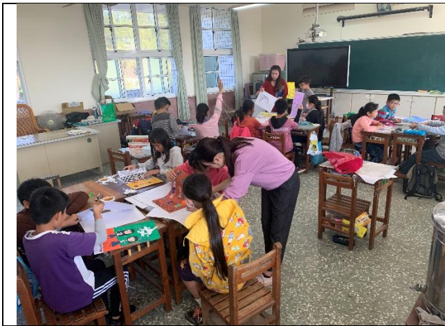
教師與藝術家協同教學