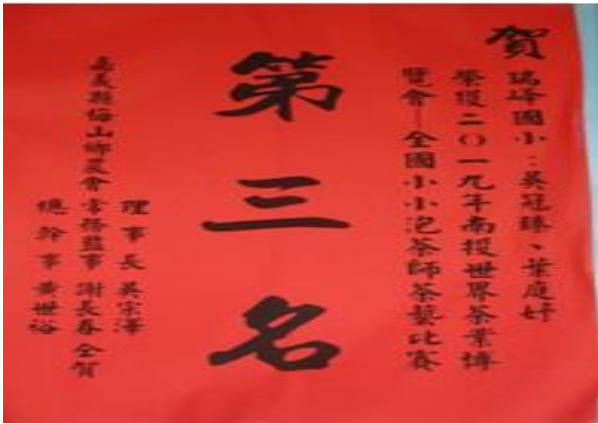
南投泡茶比賽勇奪全國第三名