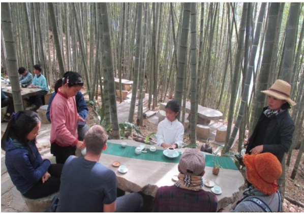
中高年級至竹林上茶道課程-遊客可品茗