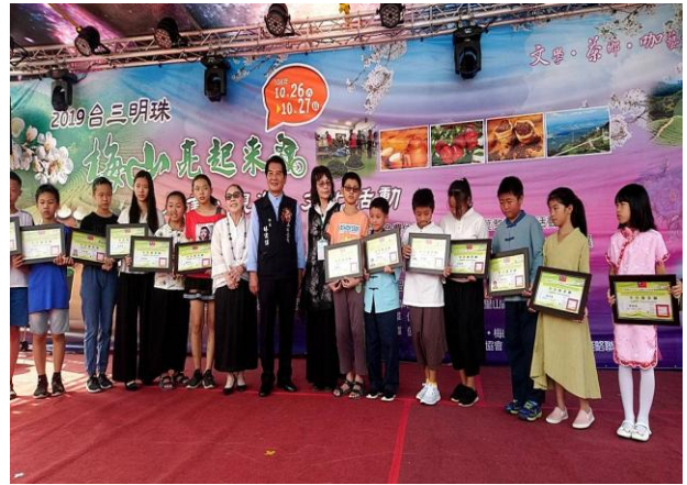
小小泡茶師認證頒獎