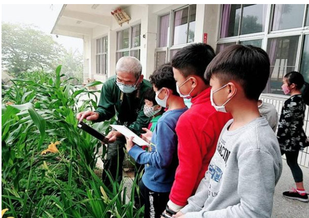
中年級上攝影課程