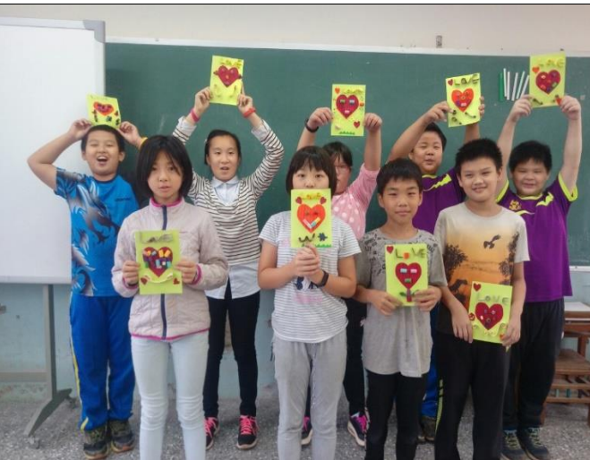
高年級母親節卡片創作