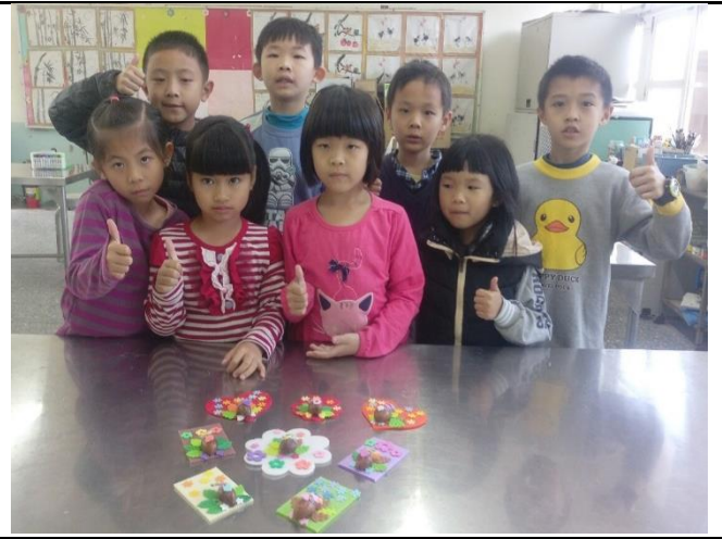
低年級植物種子造型創作