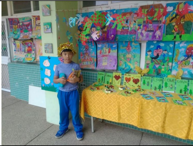
辦理校內學生藝術作品展