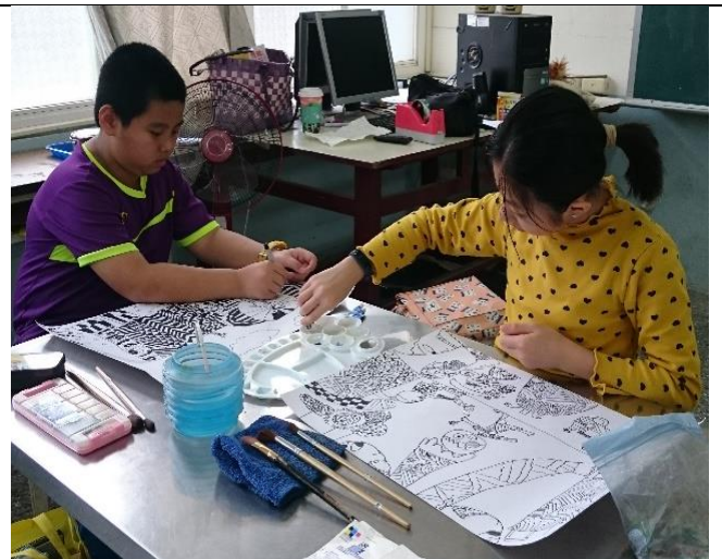
高年級平面設計課程