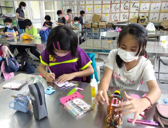
中年級保特瓶存錢筒製作