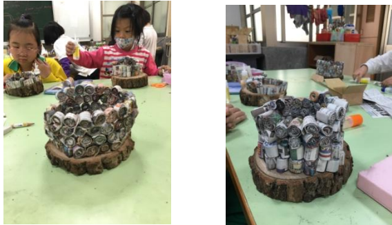
低年級學生製作燈座