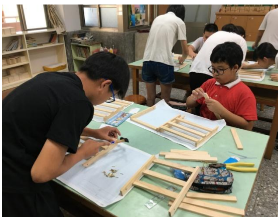
高年級學生製作閱讀書架