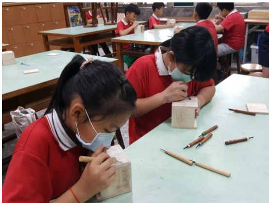
中年級學生製作筆筒