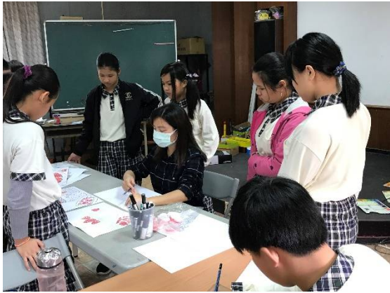
老師示範如何構圖