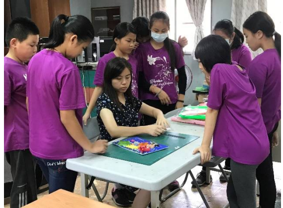
老師示範如何構圖