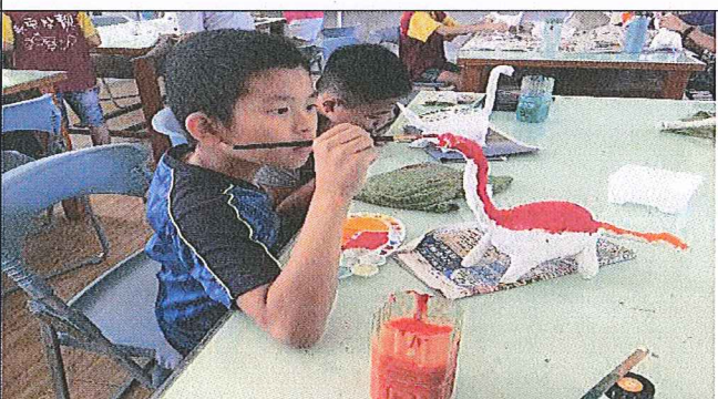
高年級學生幫紙恐龍上色