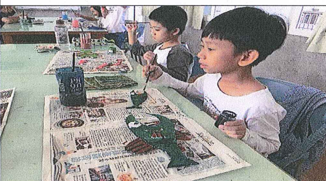
中年級學生幫紙魚上色