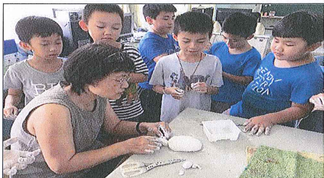
玉婷老師指導中年級學生如何捏塑紙海龜