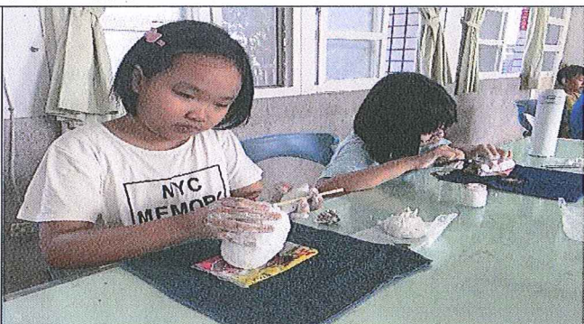
中年級學生捏塑紙海龜