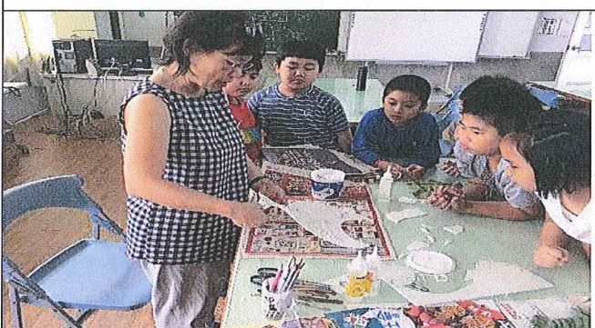
玉婷老師指導中年級學生如何捏塑紙魚