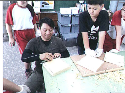
圖六：藝術家說明木盤雕刻正面深度測量技巧