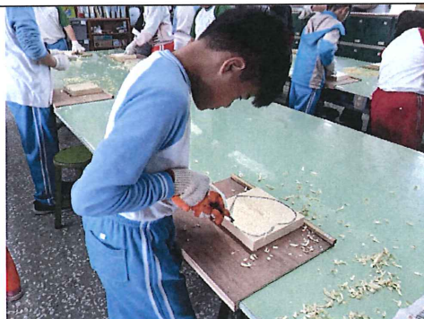
圖五：學生雕刻木盤子正面