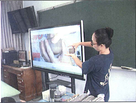
圖一：藝術家透過大型觸控顯示器，示範如何用拇指壓出杯體