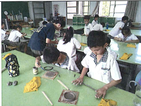
圖三：學生動手製作土條