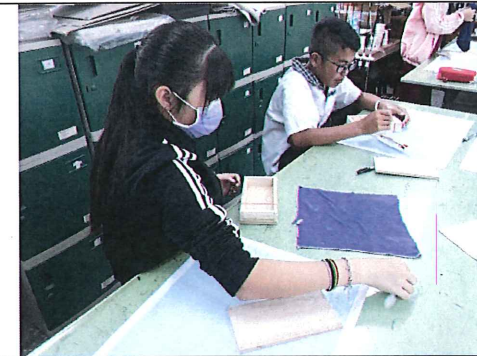
圖八：學生利用木工膠組合木鉛筆盒，並以橡皮筋進行固定