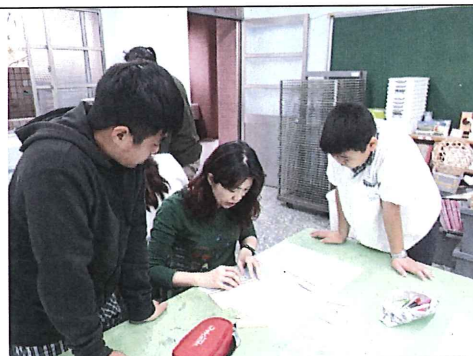
圖七：協同教師指導學生進行木鉛筆盒盒蓋鑽孔位置量測及標記