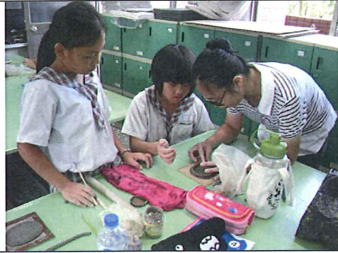
圖二：藝術家示範如何將土條繞貼在底座上