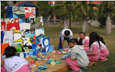
照片說明：露天的靜態表演場。