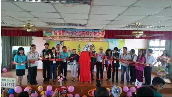
照片說明：具表演舞台的視聽教室