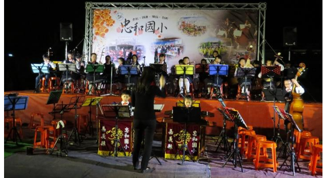
照片說明：策展場地