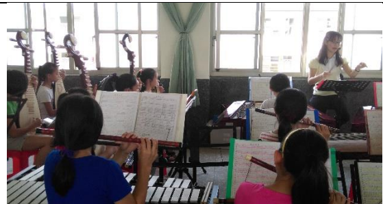
照片說明：國樂練習教室。