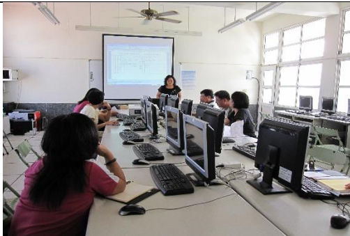
照片說明：電腦教室提供互動室教學。