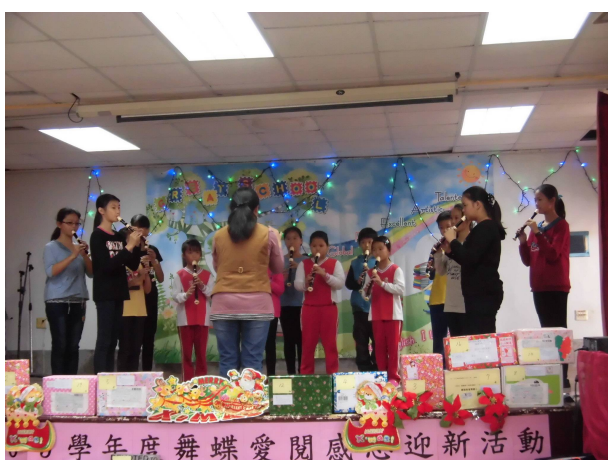
視聽教室是學生自我展現的最佳場所