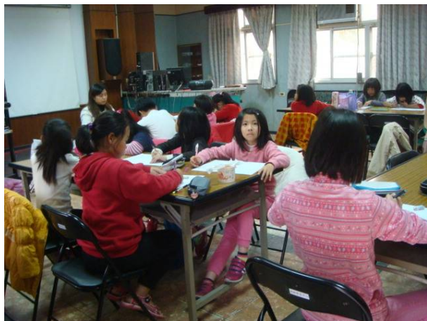
樂齡場地寬廣作為繪畫課教室