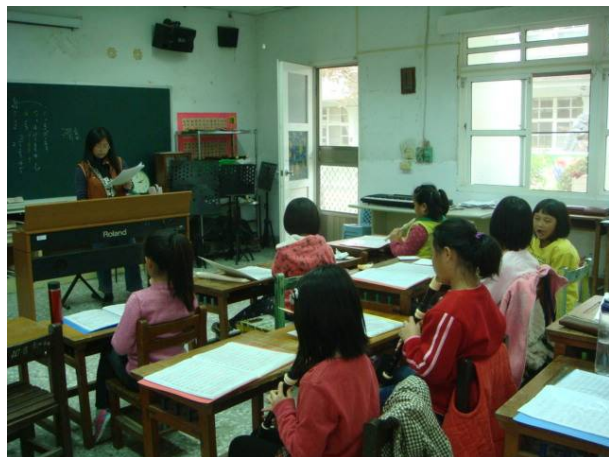
音樂教室作為直笛課程上課地點