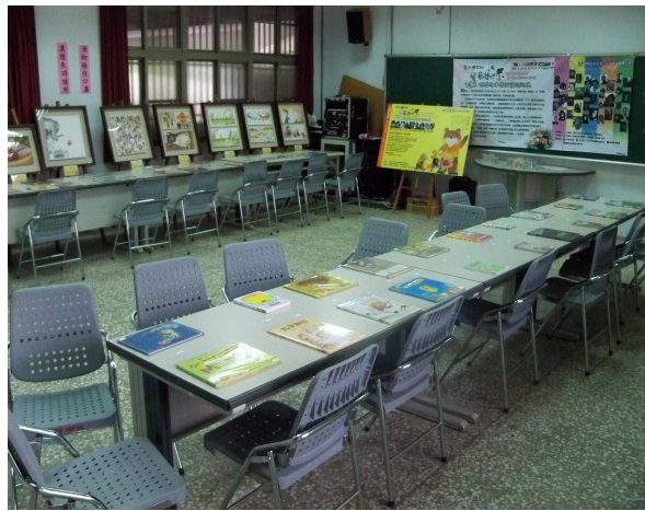
視聽教室（展示作品場地）