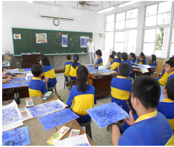
美勞專科教室（藝文上課及展示作品場地）