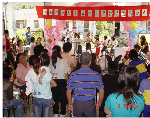
中廊（表演藝術教學及展演場）